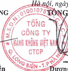
Dương Trí Thành